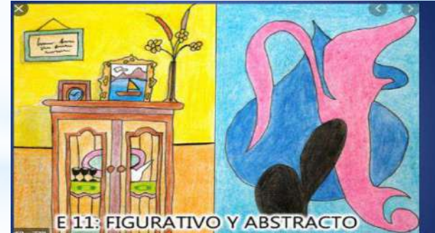
E 11: FIGURATIVO Y ABSTRACTO

En la primera obra puedo identificar lo que es, pero en la segunda el autor debe haber representado algún sentimiento o algo que para él representa mucho.